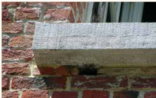
Photo 15 – Des martinets nichaient sous plusieurs tablettes de fenêtre de ce bâtiment universitaire. Lors du ravalement des façades, la KU Leuven, propriétaire, a accepté une « rénovation douce » : laisser deux orifices accessibles sous chaque appui de fenêtre suffisamment élevé. Les Martinets ont adopté ces espaces au point de développer la colonie locale / Common Swifts were nesting under various window sills of this university building. During the upgrading of the building facades, the proprietor, KU Leuven, agreed to a "soft refurbishment", leaving two access holes under each of the upper window sills. The Common Swifts adopted these spaces and a local colony developed

Du côté du GTM, le nouveau propriétaire d'une ancienne bâtisse située à Hulsonniaux, rénovée juste avant la vente, a décidé de rétablir 6 trous colmatés où il avait pu observer des martinets entrer et sortir. Après concertation avec le GTM, il a retiré la nouvelle maçonnerie au burin puis réalisé un orifice esthétique (Photo 16) s'inspirant du moule conçu par l'association britannique Action for Swifts 4 .