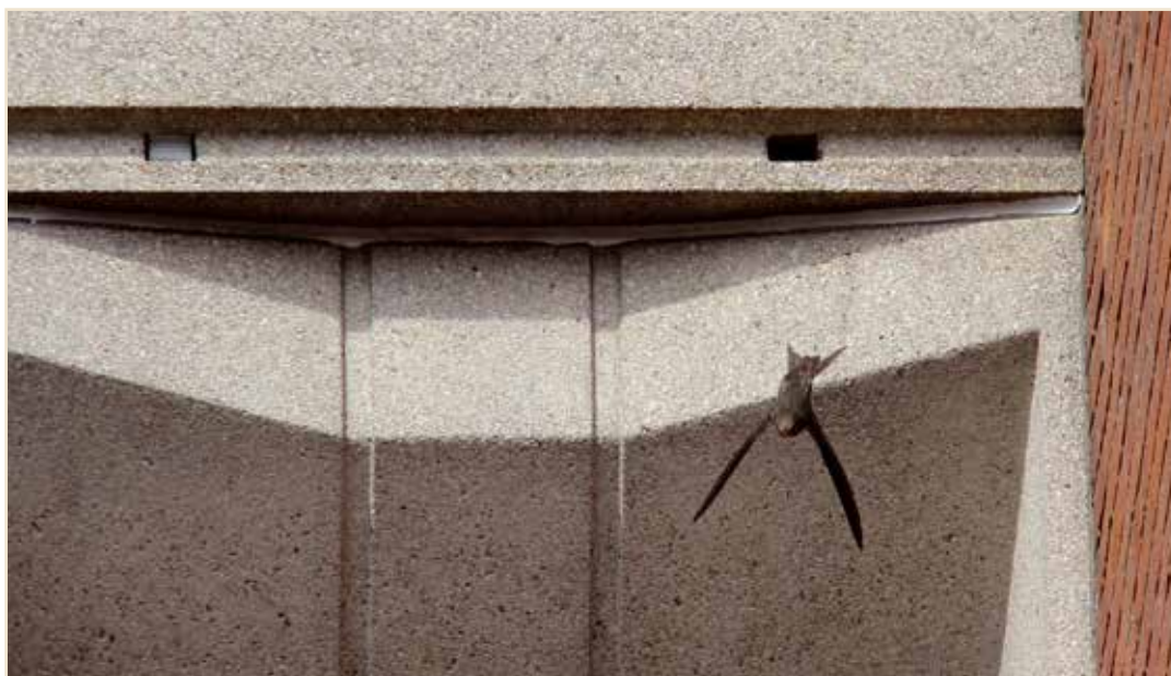
Photo 13 – Suite aux conseils du GTM, l'athénée Toverfluit a accru la capacité d'accueil des martinets nichant dans ses bâtiments en retirant les grilles des trous de ventilation encore bouchés (comme le trou de gauche) / Following the advice of the Swifts Working Group, the Toverfluit Secondary School has increased the places where Common Swifts may nest in its buildings by removing the wire grills that blocked ventilation holes (as the hole on the left)