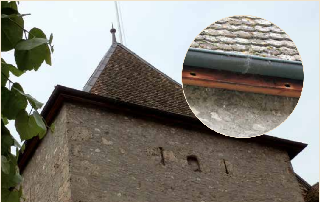
Photo 9 – Gros plan sur une discrète « fausse corniche pour martinets » au Château de Rolle / View from above of a discrete «false cornice» provided for Common Swifts at the Château de Rolle