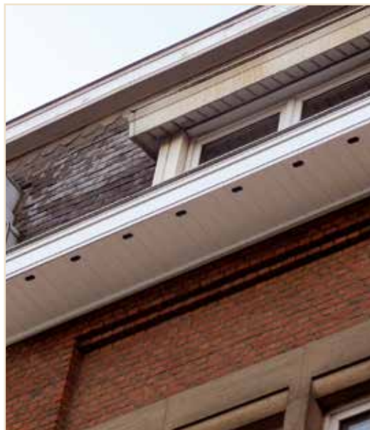
Photo 7 – Nouvelle corniche qu'un particulier a aménagée pour les Martinets / A new cornice that a householder has provided for Common Swifts