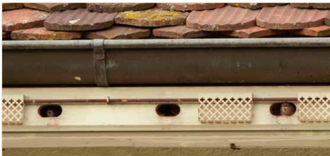
Photo 2 – Jeune Martinet (à gauche) et jeune Moineau (à droite) : ces espèces peuvent cohabiter pacifiquement si le nombre de cavités disponibles est suffisant / Young Common Swift (left) and young House Sparrow Passer domesticus (right): if there are enough suitable cavities these species can coexist peacefully