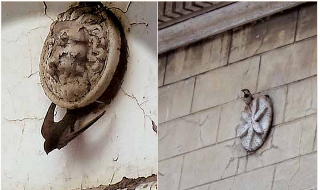
Photos 10a et b – Les trous de boulin entrouvert permettent la nidification du Martinet, mais également du Moineau domestique / Whent ajarred, putlog hole offer suitable cavities for Common Swift and House sparrow