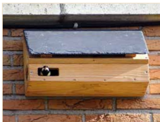
Photo 18 – En plaçant des nichoirs à martinets, vous aiderez aussi plusieurs autres espèces citadines, dont le Moineau domestique ou, comme ici, la Mésange charbonnière (notons que ces espèces sédentaires s'abritent parfois ponctuellement dans des nichoirs de martinets, pendant l'hiver). En l'absence de corniche, une double toiture inclinée à 45° protégera les occupants des prédateurs au nid et d'un trop fort ensoleillement, tout en améliorant la longévité de vos nichoirs (protection contre la pluie) / In installing nest boxes for the Common Swift you will also help various other town birds, such as the House Sparrow, or as here the Great Tit Parus major (note that these resident species sometimes use Swift nest boxes during the winter). Where there is no cornice a sloping double roof at 45° will protect the occupants of the nest box from predators and over-strong sunlight, while also lengthening the life of your nest box (protection against rain)