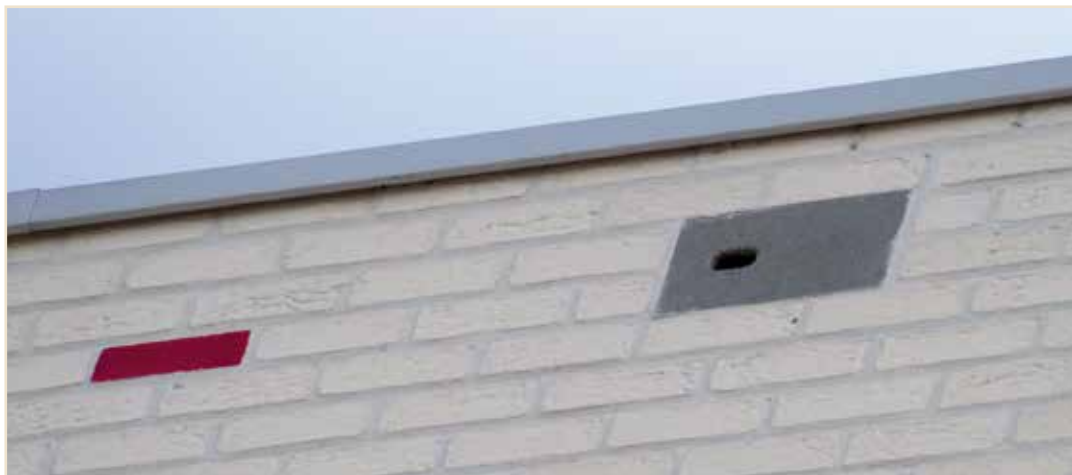
Photo 14 – Dans ce bâtiment passif bruxellois, plusieurs briques-nichoirs ont été intégrées à la façade, parmi les briques colorées décoratives. Cet aménagement discret et esthétique a fait ses preuves aux quatre coins d'Europe : les Martinets, mais aussi les Moineaux, les trouvent généralement plus vite que de simples nichoirs extérieurs, car ils s'apparentent bien aux trous de ventilation que ces oiseaux connaissent bien / In this Brussels "passive" building, several nesting-bricks were incorporated among the decorative coloured bricks in the facade. This discreet and aesthetically pleasing improvement has proven its worth in buildings across Europe: Common Swift and House Sparrows generally find these bricks more quickly than simple external nest boxes, because they resemble the ventilation holes with which these birds are already familiar

D'autres nichoirs intégrés (15 pour martinets, répartis entre 5 bâtiments) sont en cours d'installation à Laeken, dans le futur éco-quartier Tivoli. Dans les nouveaux projets qu'accompagne le GTM, les architectes décident de plus en plus de concevoir des aménagements « mixtes » pour la biodiversité, où ils prévoient des nichoirs intégrés non seulement pour les Martinets, mais aussi pour les Moineaux et pour les chauves-souris.