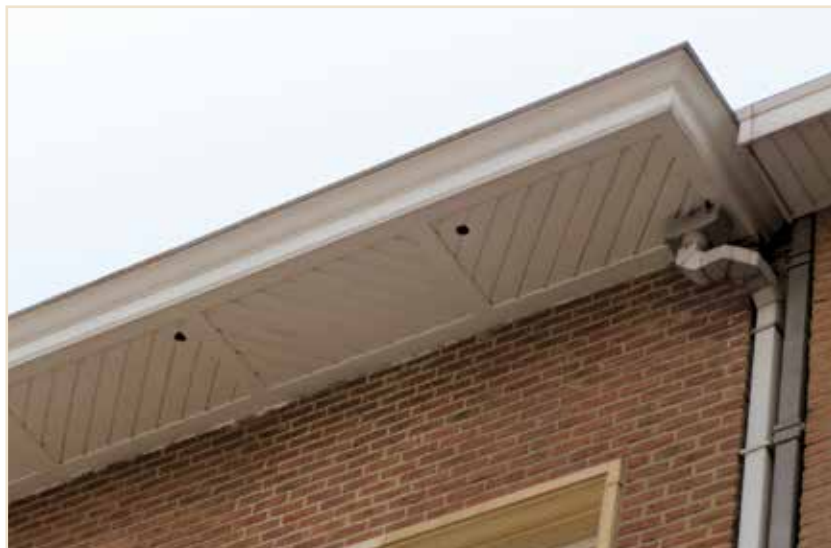
Photo 8 – Trous réalisés dans la corniche d'un bâtiment, lors d'une réfection de toiture / Holes made for Swifts in the cornice of a building during roof repairs

nouvelles ou anciennes corniches. Selon les cas, elles offrent de 1 à 13 logettes. Au total, cela représente 96 cavités.