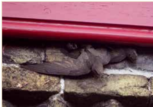
Photo 3 – Si les cavités disponibles sont insuffisantes, les oiseaux se disputent les sites de reproduction / If there are not enough cavities available, then the birds compete for the same breeding place