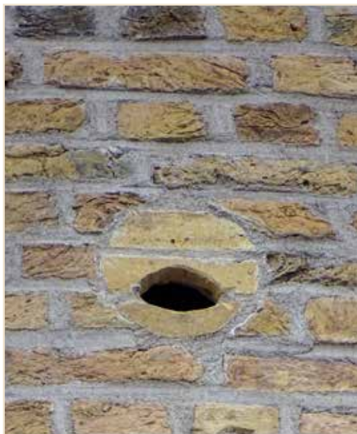
Photo 12 – Aménagement discret d'un trou de boulin au moulin de Standdaarbuiten (Pays-Bas) / A discrete putlog hole installed at the Standdaarbuiten mill (Netherlands)