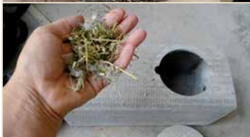
Photos 19a et b – Au-dessus, un nid typique de Martinet. En plaçant une petite poignée de matériaux (photo b), vous pouvez accélérer l'adoption de vos nichoirs / On the above picture, a typical nest of the Common Swift. By placing a small handful of nesting material (Photo b) you can speed the adoption of your nest boxes