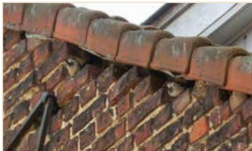
Photo 4 – Les espaces sous les tuiles de rives, populaires tant chez les Martinets que chez plusieurs autres espèces, comme ici les Moineaux / The spaces under the verge tiles are favoured both by the Common Swift and by several other species; in this case the House Sparrow