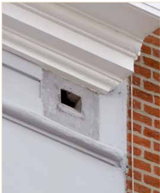
Photo 11 – Aménagement de trou de boulin « à l'italienne » / An italian style putlog hole