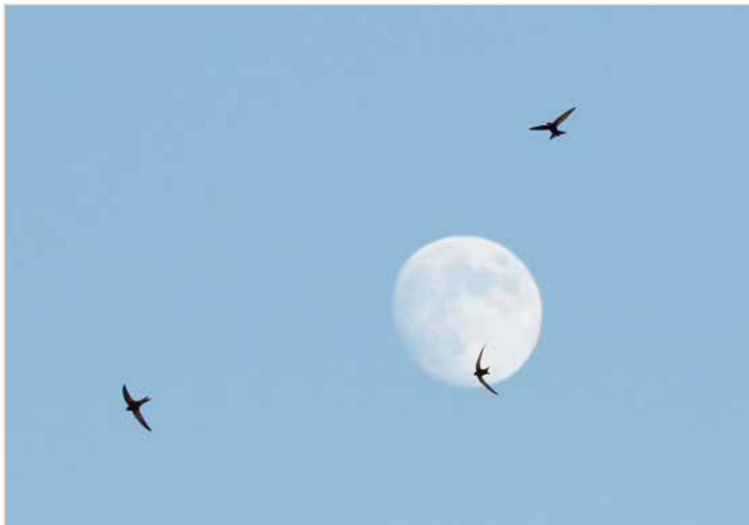
Photo 1 – Avec son corps fuselé, le Martinet noir est parfaitement adapté à sa vie presque exclusivement aérienne / With its streamlined body the Common Swift is perfectly adapted to a life spent almost entirely on the wing

Largement répartie sur pratiquement toute l'Eurasie durant la courte période de nidification, cette espèce vit 9 mois par an en Afrique subsaharienne, entre le bassin du Congo et l'Afrique du Sud (CHANTLER et al. , 2018). Chaque année, les individus migrent jusqu'à 10.000 km pour se reproduire dans son aire eurasiennne. La maturité sexuelle est atteinte dans le cours de la 3 e voire 4 e année de leur vie ; les immatures réalisent également ce long périple mais ne séjournent que deux petits mois, voire même un seul lors de leur premier voyage, au cours de leur 2 e année calendaire (GENTON & JACQUAT, 2014). Les oiseaux mettent à profit cette courte période pour déjà rechercher un site de nidification approprié, durant les « rondes sonores » qu'ils accomplissent,